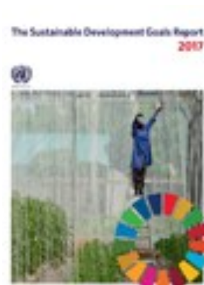
Sustainable Development Goals Report 2017