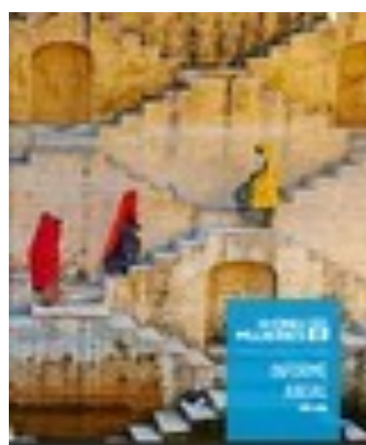
Informe Anual 2015-2016. ONU Mujeres