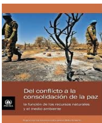
Del conflicto a la consolidación de la Paz. PNUMA 2016