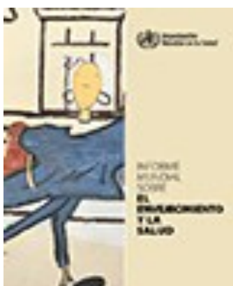
Informe Mundial sobre el envejecimiento y la salud.